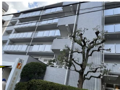
Nafion 系光触媒施工後 20 年経過のマンション外装

バインダー樹脂成分の Nafion はどのような光触媒反応にも 20 年以上にわたり耐える実績を有している唯一の現場施工可能なフッ素樹脂です。